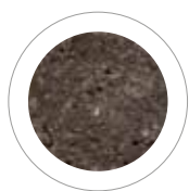
TORFOWY BRĄZ ANTICO